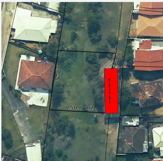
IMAGEM DO IMÓVEL